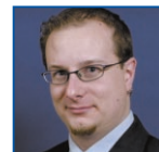
Ugo de Montigny Circonscription 16