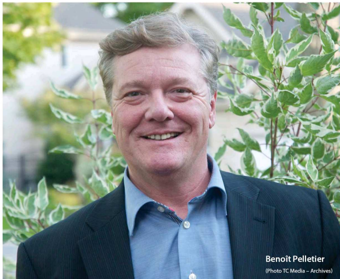
Benoît Pelletier