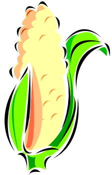
Légende accompagnant l'illustration.

Les informations les plus importantes se trouvent ici, à l'intérieur de la brochure. Présentez votre organisation ainsi que les produits ou services spécifiques qu'elle propose. Ce texte doit être